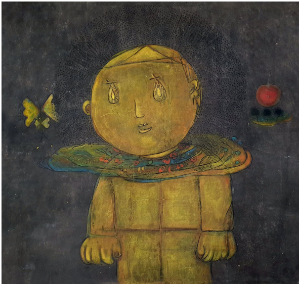
세상을 사랑하는자 | 91x86cm | 한지에 분채 | 2016