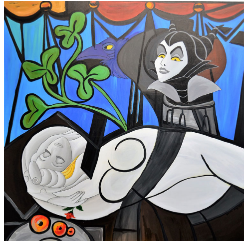
피카소 | 130x130cm | 아크릴, 바니시 | 2017