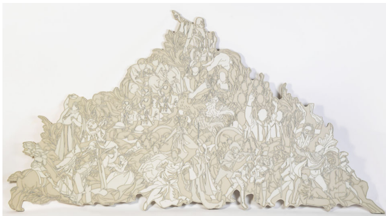
반복적 딜레마-페디먼트. 255×163×3cm. 포맥스,레진,아크릴물감. 2019