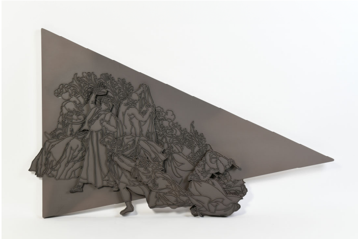
반복적 딜레마-트라이앵글. 135×85×3cm. 포맥스,레진,아크릴물감. 2019