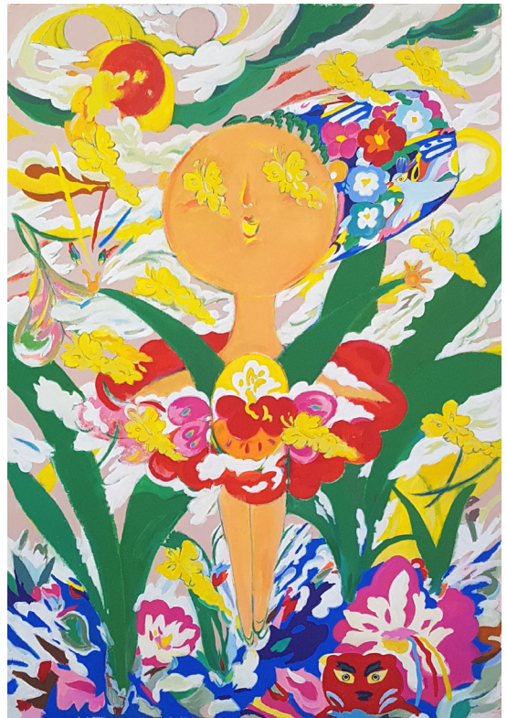
피어나는 소녀 | 193x130cm | 장지에 과슈 | 2018