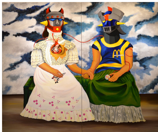
프리다 칼로 | 162x194cm | 아크릴, 바니시 | 2017