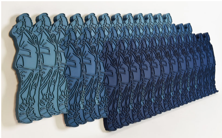
반복적 딜레마-경례 70×123×3cm. 포맥스,레진,아크릴물감. 2019