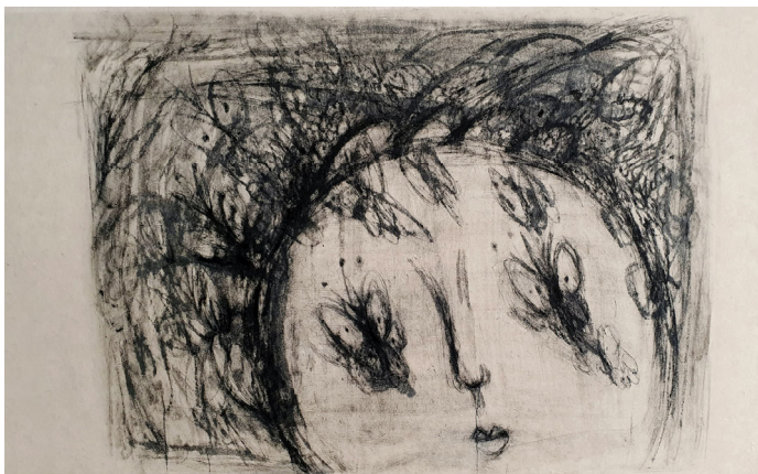
나비는 사람이된다 | 70x110cm | 한지에 먹 | 2016