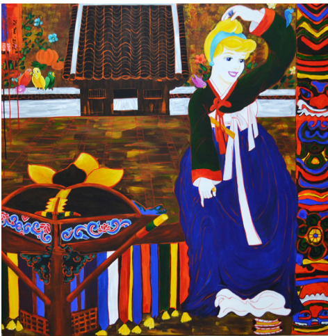
그대로 박생광 | 130x130cm | 아크릴, 바니시 | 2018