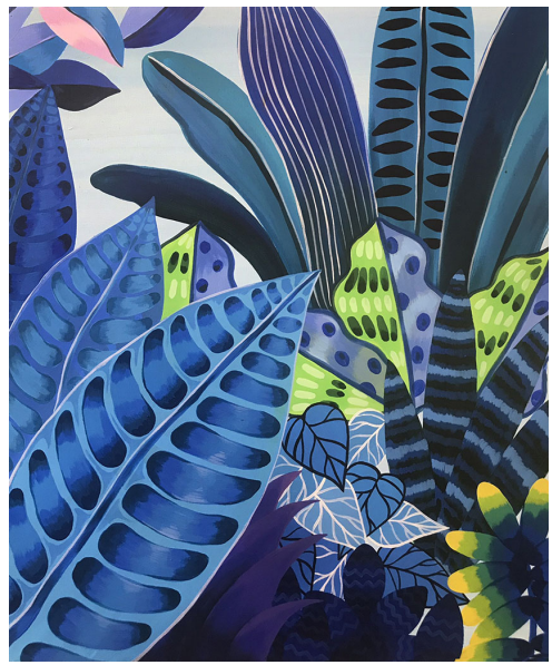
blue | 60x73cm | Acrylic on Canvas | 2019