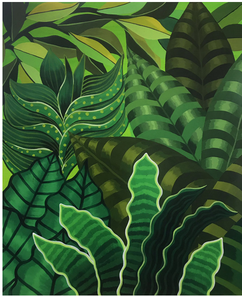
green | 60x73cm | Acrylic on Canvas | 2019